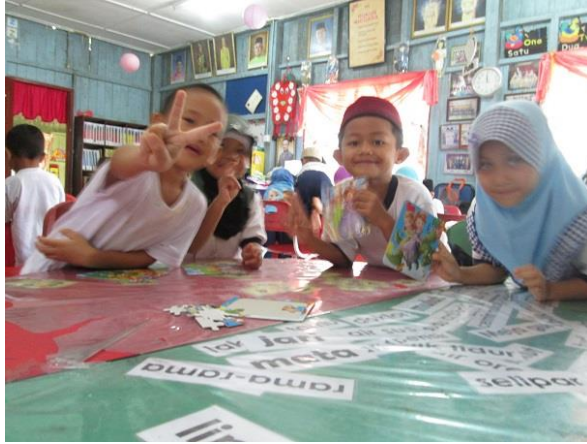
Kanak-kanak sedang menjalankan aktiviti yang diadakan oleh tenaga pengajar.