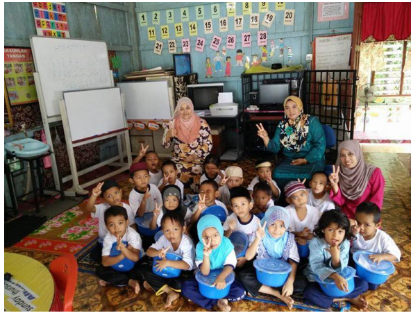
Sesi bergambar bersama kanak-kanak Tabika KMEAS dan guru-guru mereka.