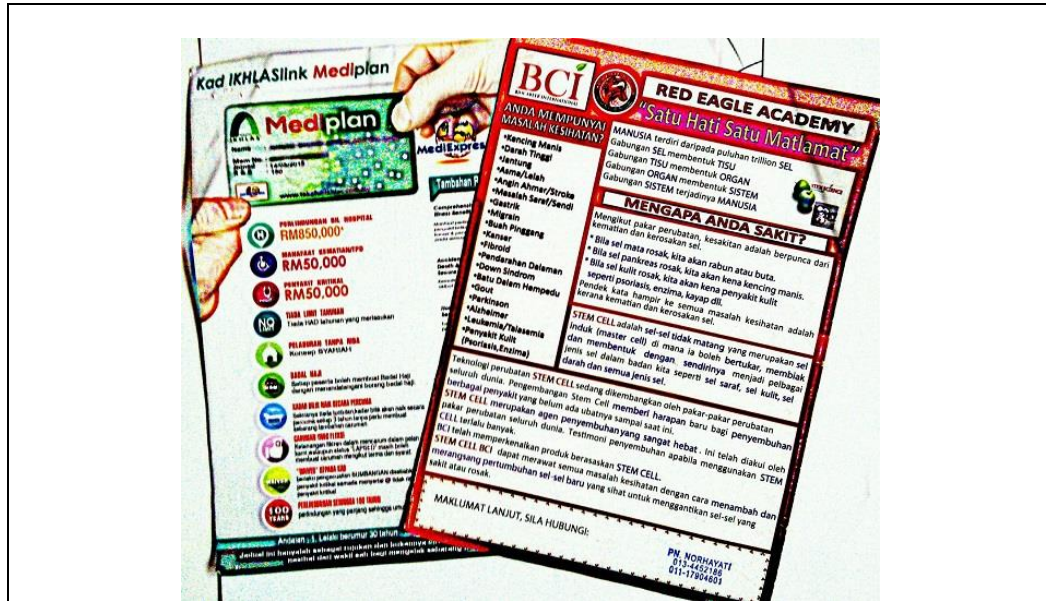
Caption : Iklan produk/perniagaan yang dijalankan oleh beliau dalam bentuk flyers.